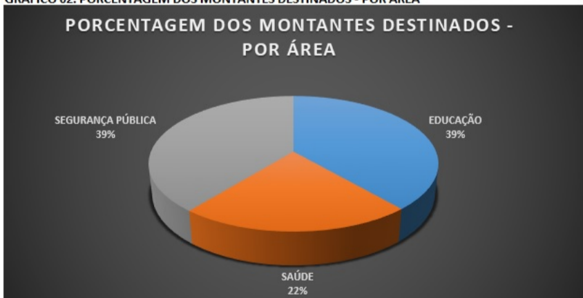
GRÁFICO 02: PORCENTAGEM DOS MONTANTES DESTINADOS - POR ÁREA